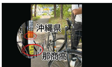
青少年の非行防止県民一斉行動 動画コンテスト 沖縄県知事賞