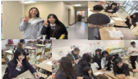
国際交流活動 カテナハイスクール来校