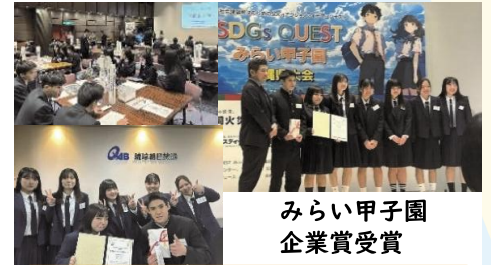
各種発表大会で入賞 授業で学んだことを実践の場で発表