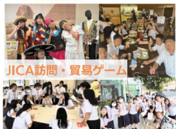
JICA訪問・貿易ゲーム 異文化理解 県内国際関連施設見学と体験活動