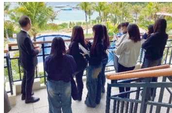
リゾートホテル見学