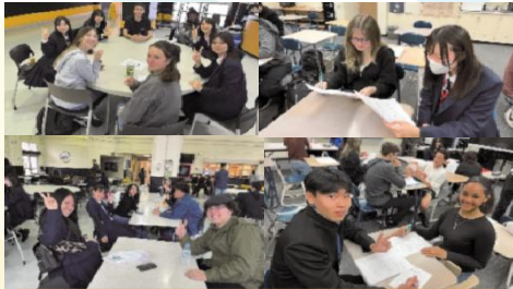
国際交流活動 カテナハイスクール訪問