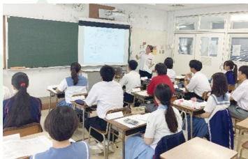
中学生の簿記基礎講座