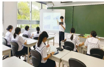
財務分析プレゼンテーション