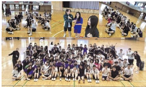
学年間連携：ゲームや球技などを通して 学科の帰属意識を形成