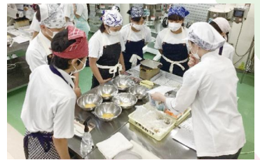
企業コラボ商品開発