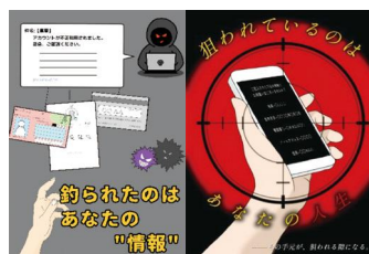
ひろげよう情報セキュリティコンクール 優秀賞