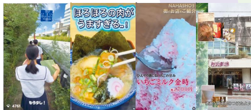
企業と連携した動画作成