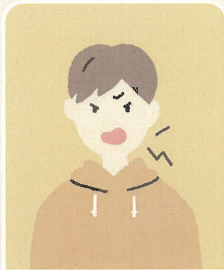
怒りやすくなった